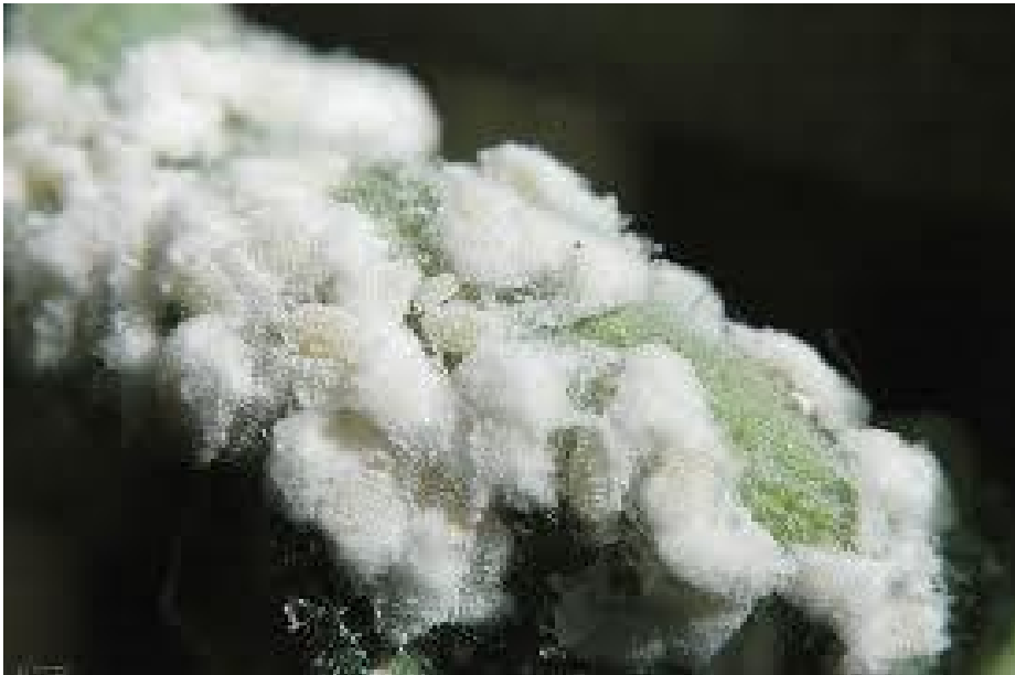
Kolonie von Wollläusen

Sie breiten sich an allen möglichen Zimmerpflanzen gerne aus. Wollläuse können problemlos mit COMBISTÄBCHEN LIZETAN (werden in die Topferde gesteckt) bekämpft werden. Wenn die Blätter der Zimmerpflanzen staubig-grau aussehen, kann man unter einer Lupe die graugrünen, etwa 0,5 mm großen Spinnmilben – meist auch im Zusammenhang mit feinen Spinnfäden – erkennen. Abwischen mit einem feuchten Tuch oder Schwamm entfernt zwar einen Großteil der Tiere, aber nach einiger Zeit sind sie wieder in voller Stärke vorhanden. In der Wohnung ist die Anwendung eines Spritzmittels zur Bekämpfung dieser Tiere immer problematisch. Daher behelfe ich mir in diesem Fall mit einem wöchentlichen Abwischen der Pflanzen, bis wärmere Temperaturen im Freien bestehen. Erst wenn es etwa 10° C hat, bringe ich die Pflanzen kurz ins Freie, besprühe sie intensiv mit ZIERPFLANZENSPRAY LIZETAN und bringe sie danach gleich wieder ins Warme. Diese Behandlung wirkt auch gegen Woll- und Blattläuse.