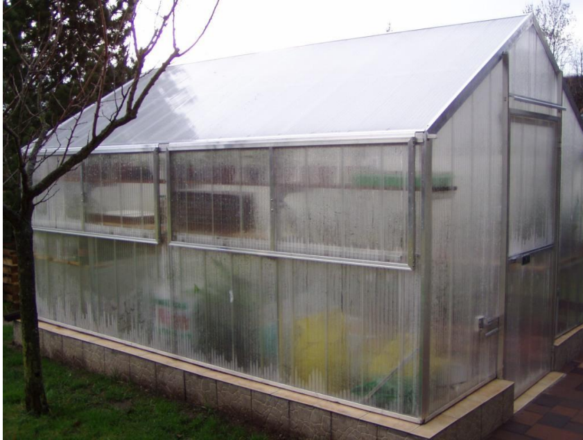
Im Glashaus können schon die ersten Gemüsearten gesät werden

Bei milder Witterung kann mit der Beetvorbereitung begonnen werden. Pflanzenreste, die noch nicht verrottet sind, entfernen und anschließend den Boden gut lockern. Danach Kompost ausbringen und die Erde harken. Die glatt gezogenen Beete bis zur Pflanzung mit Vlies oder schwarzer gelochter Mulchfolie abdecken.